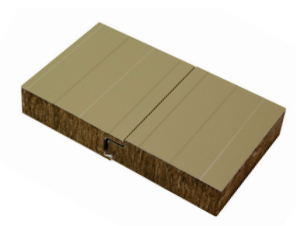
Detalle sistema fijación

HIANSIA PANEL S.A. se reserva el derecho el cualquier caso a modificar el presente documento sin previo aviso.